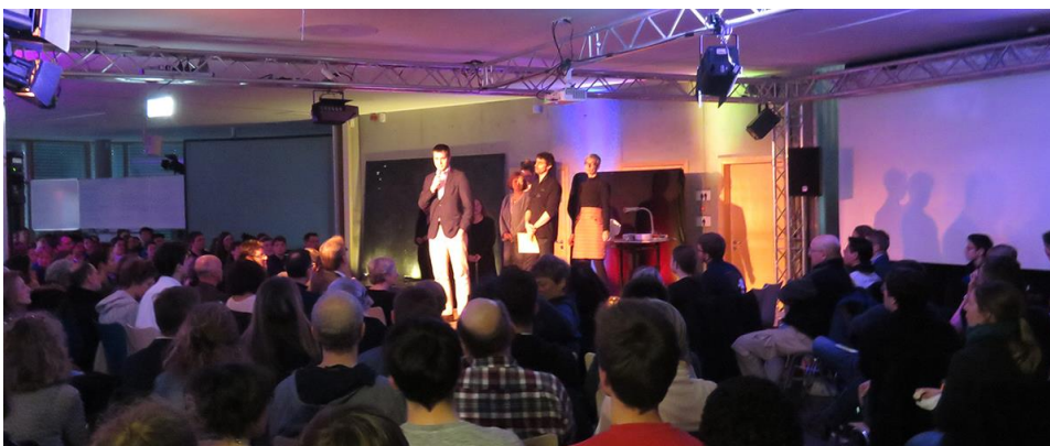
Die Soirée DupleX am Deutsch-Französischen Gymnasium Freiburg.

Um die 400 Gäste haben sich am 21. März bei der Soirée DupleX für die Wissenschaft begeistern lassen. Der Science Slam wurde vom Deutsch-Französischen Gymnasium Freiburg in Kooperation mit Eucor – The European Campus organisiert. Alle neun Kandidatinnen und Kandidaten aus Schule und Universität präsentierten zweisprachig ihr interdisziplinäres Thema in nur zehn Minuten.