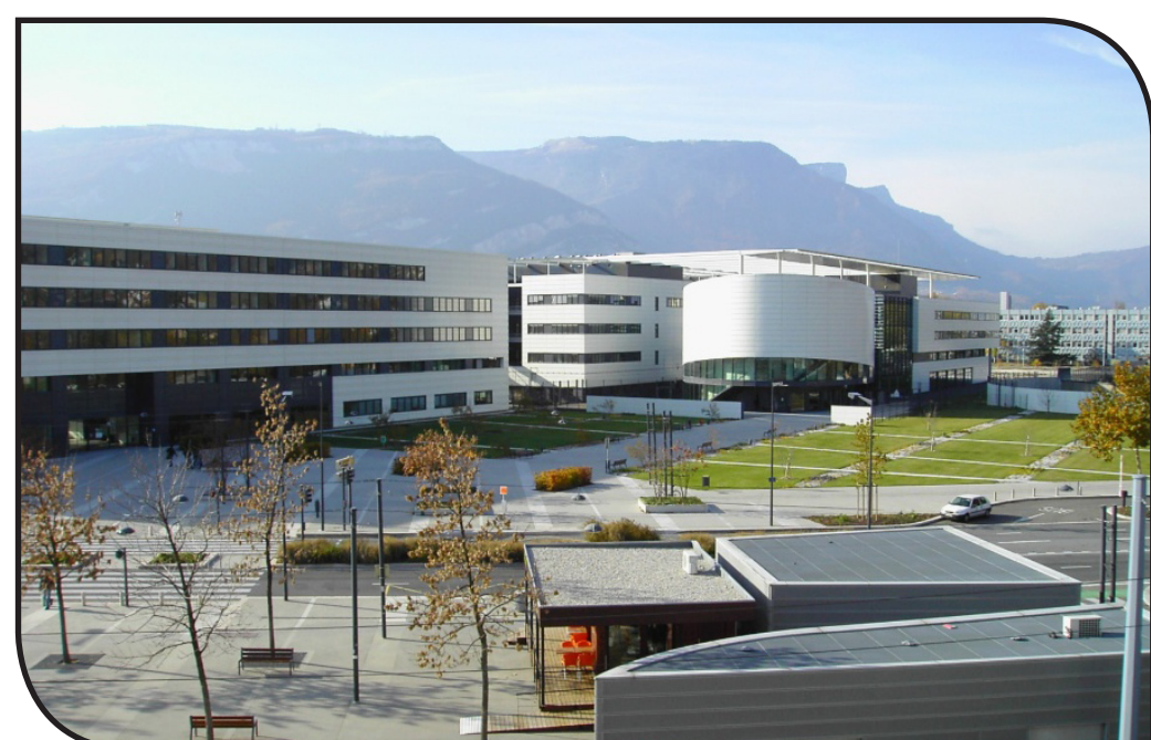
Grenoble INP – Phelma

Das Dual-Master-Programm Karlsruhe–Grenoble