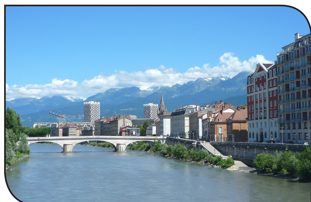
Innenstadt von Grenoble